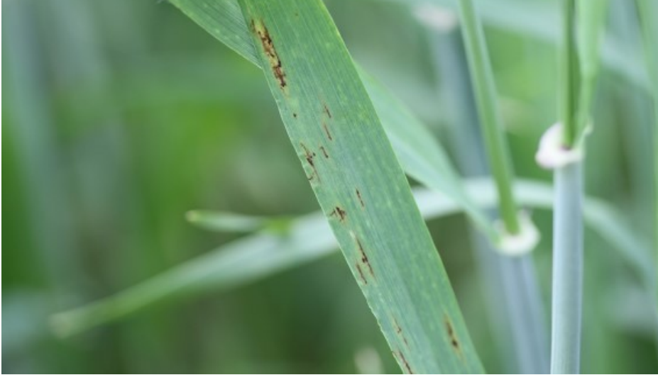
Billede 2. Friske angreb af bygbladplet i vårbyg i denne uge.