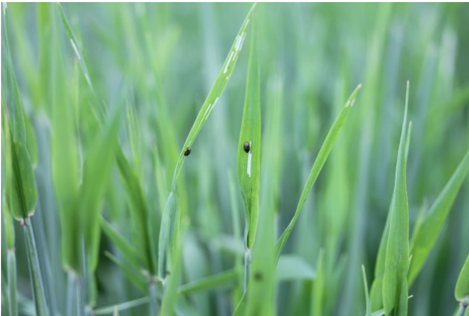
Billede 3. Kornbladbillelarver. Ikke alle larver er skyllet af i regnvejret.